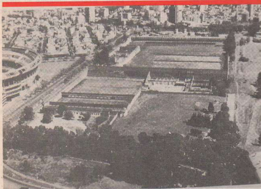
Una vista aérea de las instalaciones.

El Tiro Federal Argentino de Buenos Aires se fundó en 1891. A fin de septiembre organizará la 10º Feria Exposición de Armas y una recreación histórica de las Invasiones Inglesas de 1807.