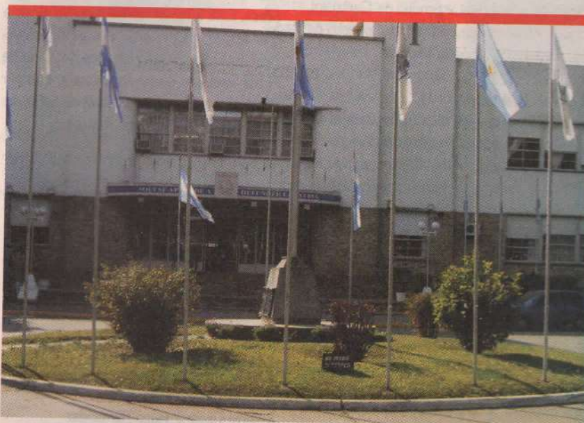
Vista del ingreso al hall principal y la playa de estacionamiento.