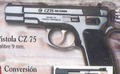
Pistola CZ 75 Calibre 9 mm.