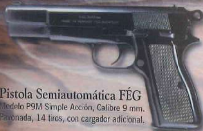
Pistola Semiautomática FÉG Modelo P9M Simple Acción, Calibre 9 mm. Pavonada, 14 tiros, con cargador adicional.