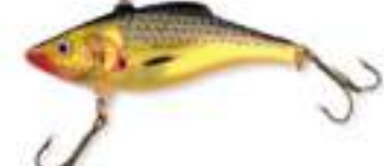
Rattlin Rap - Rapala