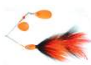
Tradicional con cola de Bucktail

Hemos recorrido algunos de los grupos principales de señuelos y descubriendo los principios de su funcionamiento. Para aquellos que deseen profundizar, nos