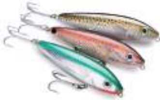
Skitter Walk - Rapala

gen parejos no tienen acción alguna. Cuentan con un lastre en la cola, de manera tal que en estado de reposo flotan semi-hundidos a 45° con la cabeza fuera del agua. Se trabajan a un ritmo sostenido y cadencioso, de pausa, tirón, pausa, tirón. Ejemplos: Skitter Walk de Rapala, Super Spook de Excalibur, Dog de Mirrolure, Thunder Dog de Storm, Ghost de Manns, Frenzy Walker de Berkley y Banana Boat de Yo-Zuri.