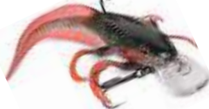
Crankbait + Plastic Tail de Storm

do cuerpos rígidos y paletas con colas de látex, mejorando la acción. En general, se trabajan como simples crankbaits .