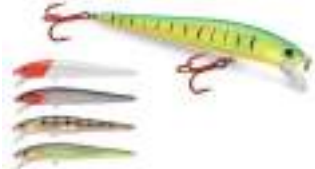
Thunderstick - Storm

simulando un pez en problemas. En general, también pueden trabajarse como crankbaits , aunque en ese caso su acción es muy suave.