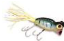
Hula Popper - Arbogast

• Crawlers: los crawlers ( nadadores ) tienen una acción superficial ondulante, asimilable a la de un nadador de estilo crawl . Esto lo logran gracias a una paleta convexa o a "alas" metálicas posicionadas a los costados del cuerpo o en el frente. Pueden trabajarse con pequeños tirones, pero no son necesarios para que desarrollen su atractiva "danza". Su propósito es crear la ilusión de un animal (pichón, rata, rana, etc.) en