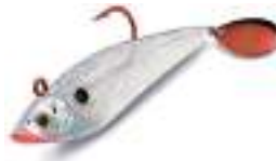
Spinner + Plastic Body de Storm