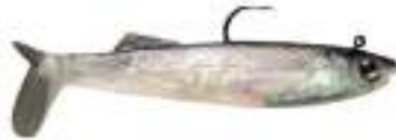
Wildeye Minnow - Storm