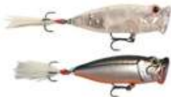
Rack Popper - Strike Pro

Pop de Rapala, Hula Popper de Arbogast, Rack Popper de Strike Pro, Chugger de Heddon, Pop-R de Rebel, Popa Dog de Mirrolure, Knuckle Head de Creek Chub y 3D Popper de Yo-Zuri.