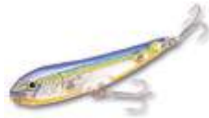
Thunder Dog - Storm

• Prop Baits y Buzz Baits: son señuelos que cuentan con una o dos hélices — propellers en inglés ( props )—, ubicadas adelante, en el centro o atrás del cuerpo. Las hélices giran y golpean la superficie del agua repetidamente mientras el señuelo es recuperado, con una acción afín a la de un motor de lancha o una batidora, y generando una turbulencia muy sugestiva. La acción del señuelo está dada únicamente por la hélice. Últimamente vemos modernos prop baits cargados con peso en la cola, agregando un leve movimiento de zigzag a las hélices. Los diversos diseños de hélice producen distintas acciones: desde la sutil y pequeña hélice de un Torpedo