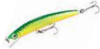
Crystal Minnow - Yo Zuri

• Crankbaits: son los señuelos de plástico, madera u otro material, con una paleta que les otorga acción cuando son recogidos con el reel o troleados. También se aplica la clasificación a los lipless como los rattlings , que deben su acción a una carga descentrada hacia delante que los hace vibrar. Exis-