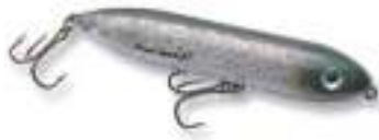
Zara Spook - Heddon