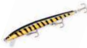
Bang O Lure - Bagley