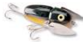
Crazy Crawler - Heddon