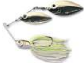
Con tándem de 2 cucharas Willow Leaf