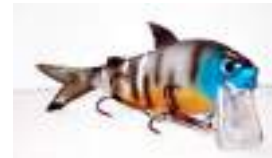
Crankbait + Plastic Tail

• Spinners & Spinnerbaits: los spinners son las tradicionales cucharitas giratorias; es decir, una forma redondeada de metal pivoteando en un eje gracias a la acción del paso del agua. Existen 4 formas básicas: Colorado, Indiana, Willow Leaf (“hoja de sauce”) y French. Cuánto más redonda es la cuchara mayor el ángulo en que trabaja, menos las vueltas que le da al eje y mayor es la vibración y sustentación que tiene (ver Gráfico ).