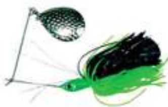
Con cuchara simple Colorado