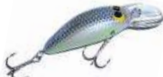
SP Wiggle Pro - Strike Pro