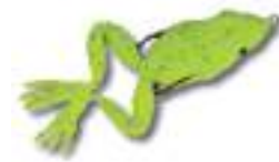
Original Frog - Snag Proof