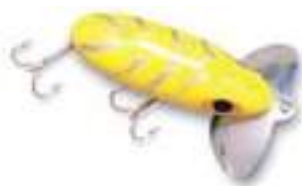
Jitterbug - Arbogast

problemas tratando de acercarse a una costa o simplemente nadando. Los más famosos de este grupo son Crazy Crawler de Heddon (creado en los años '40) y Jitterbug de Arbogast.