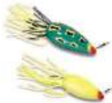
Moss Boss - Heddon

largos y suaves tirones que pueden aplicarse para trabajarlos. Ejemplos son la cuchara plástica Moss Boss de Heddon, Original Frog y Moss Rat de Snag Proof, y la mayoría de los señuelos de látex ( plastics ) que trabajan en superficie.