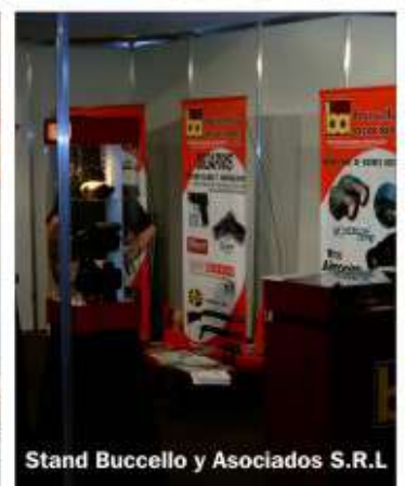
Stand Buccello y Asociados S.R.L.