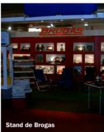
Stand de Brogas