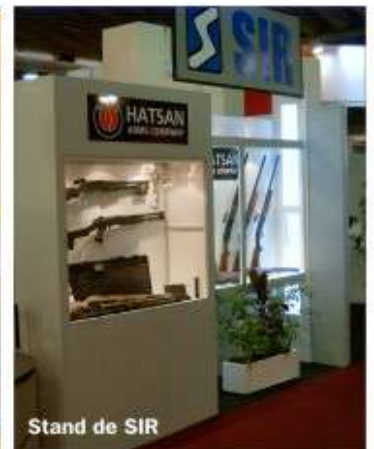
Stand de SIR