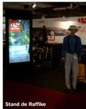
Stand de Raffike