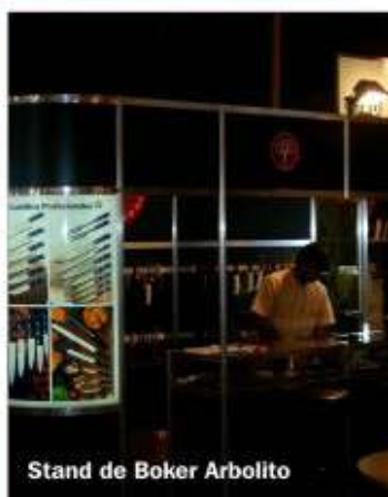
Stand de Boker Arbolito