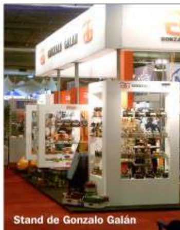
Stand de Gonzalo Galán