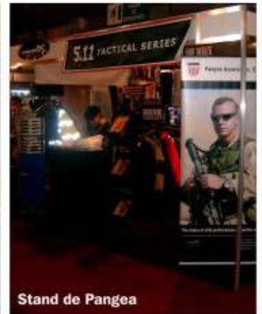
Stand de Pangea