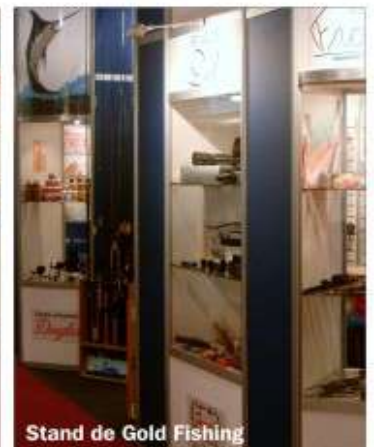
Stand de Gold Fishing