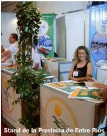
Stand de la Provincia de Entre Ríos