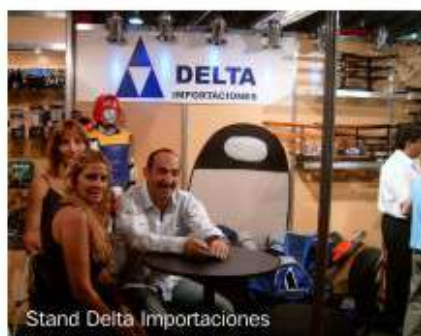
Stand Delta Importaciones